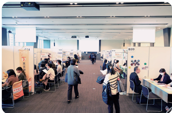
2023年12月 看護のお仕事応援フェア 就職説明会の様子